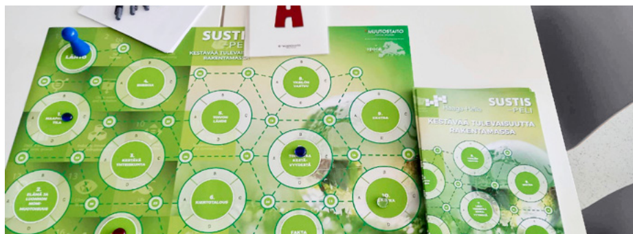
KESTO-hankkeen aikana kehitettiin Sustis-peli, jonka toteuttaminen kiteytyi siihen, miten vastuullisuuden ja kestävä kehityksen osaamiseen liittyviä teemoja voidaan lisätä pelillisin keinoin osaksi Haaga-Helian opintoja.

Vastuullisuus on tärkeä osa Haaga-Helia ammattikorkeakoulun toimintaa. Vastuullisuus- ja kestävyystavoitteita edistetään yhdessä henkilöstön, opiskelijoiden ja yhteistyökumppaneiden kanssa.