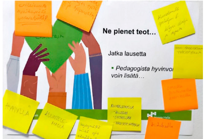
Koulutuksessa käytiin läpi muun muassa Pedagogista hyvinvointia.

Meidän koulu! -henkilöstökoulutuksella edistetään oppilaitosten hyvinvointia, osallisuutta ja turvallista toimintakulttuuria.