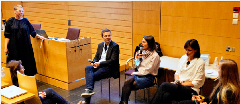
KESTOn vastuullisuusseminaari pidettiin maaliskuussa 2022. Kuvassa osallistujia Itä-Suomen yliopistosta, Haaga-Heliasta, Arcada ammattikorkeakoulusta ja Tampereen yliopistosta.

Arcadan johdolla tutkittiin, mitä kestävyys koulutuksessa ja oppimisessa tarkoittaa ja miten se näkyy mm. valtiohallinnon ja korkeakoulujen ohjeissa ja dokumenteissa.