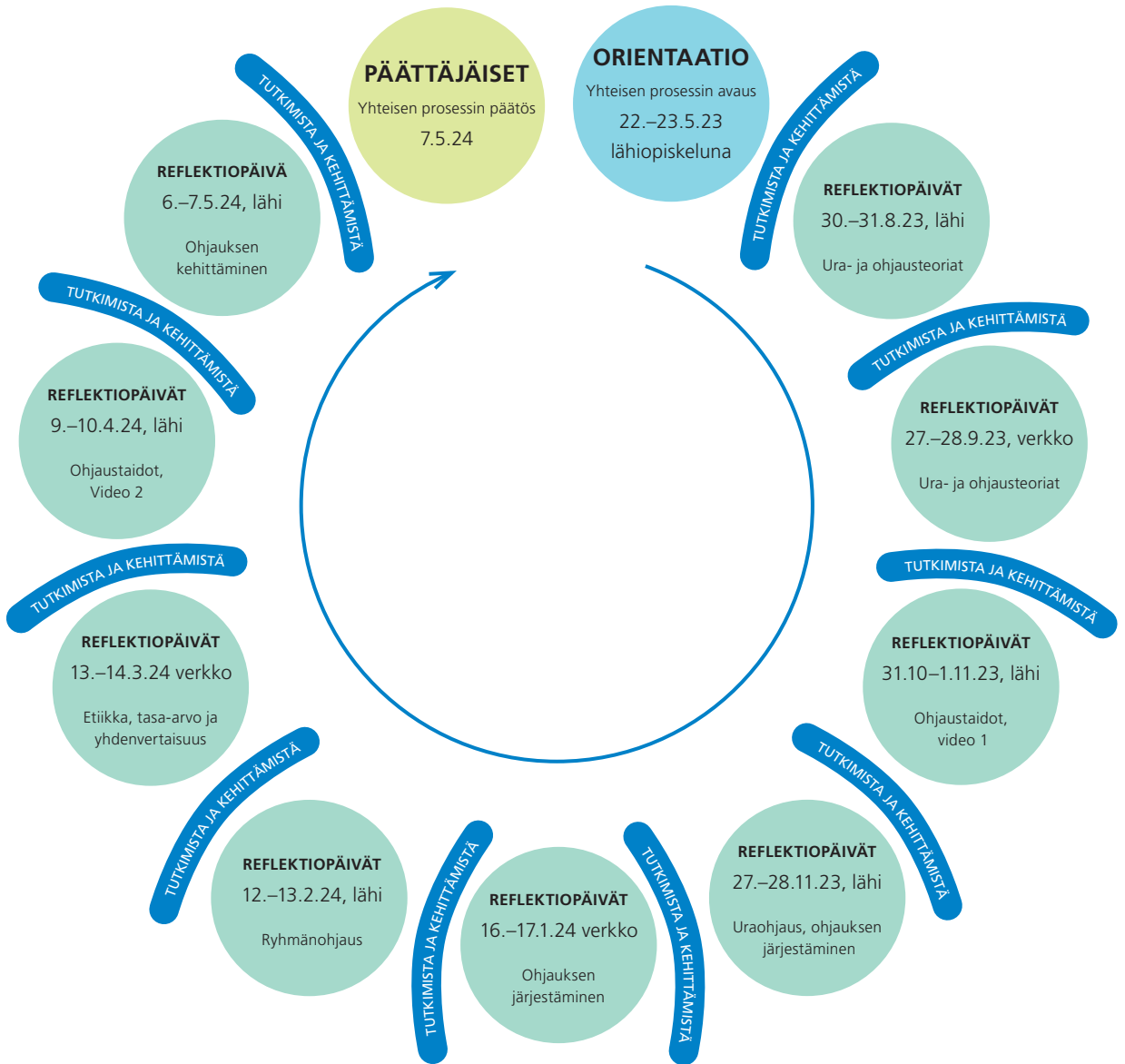
Kuvio 2. Reflektiopäivät opinto-ohjaajakoulutuksessa.