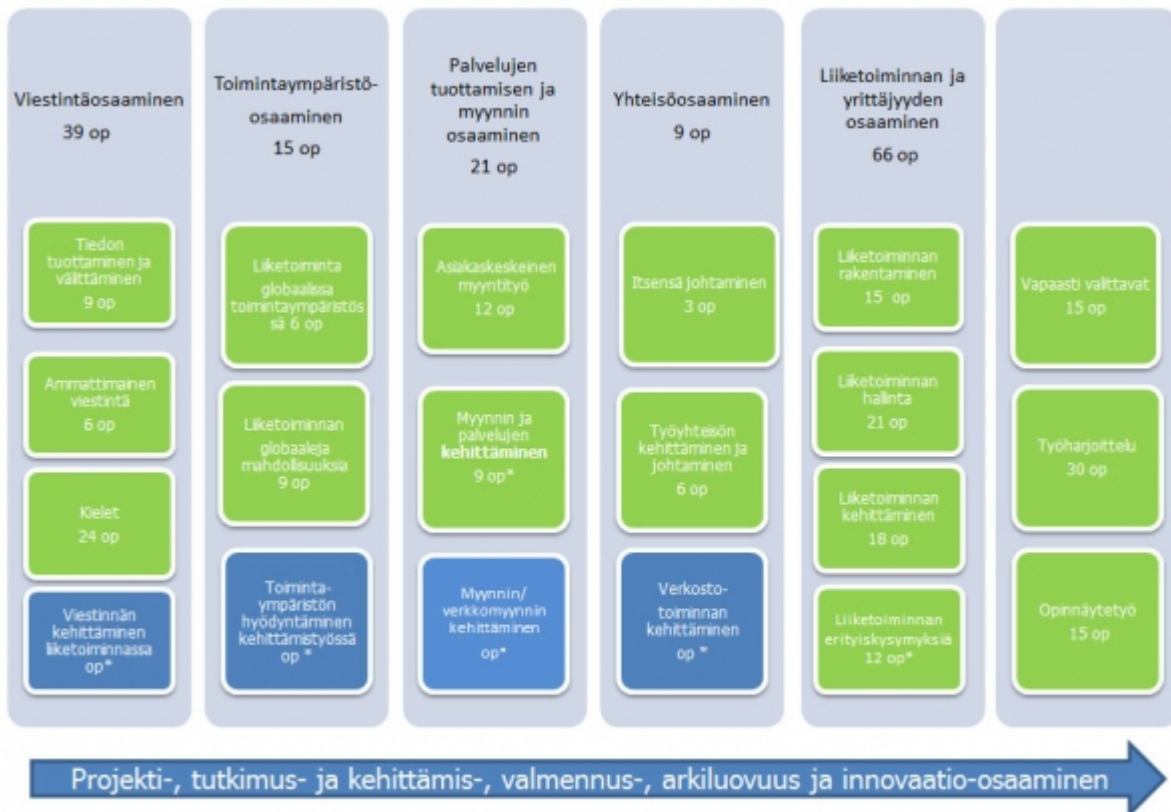
Kuvio 2: Tradenomin opintojen rakenne, moduulit ja opintojaksot. (Siniset laatikot kuvaavat vapaasti valittavia moduulioopintoja) * opintopistemäärä yksilöllisesti valittavissa.

Opiskelija voi henkilökohtaisen opetussuunnitelmansa mukaisesti hyödyntää Campuksen tarjoamaa mahdollisuutta toimia eri koulutusohjelmien projekteissa ja opintokokonaisuuksissa suomen, ruotsin ja englannin kielellä, mikä laajentaa hänen erikoistumismahdollisuuksiaan.