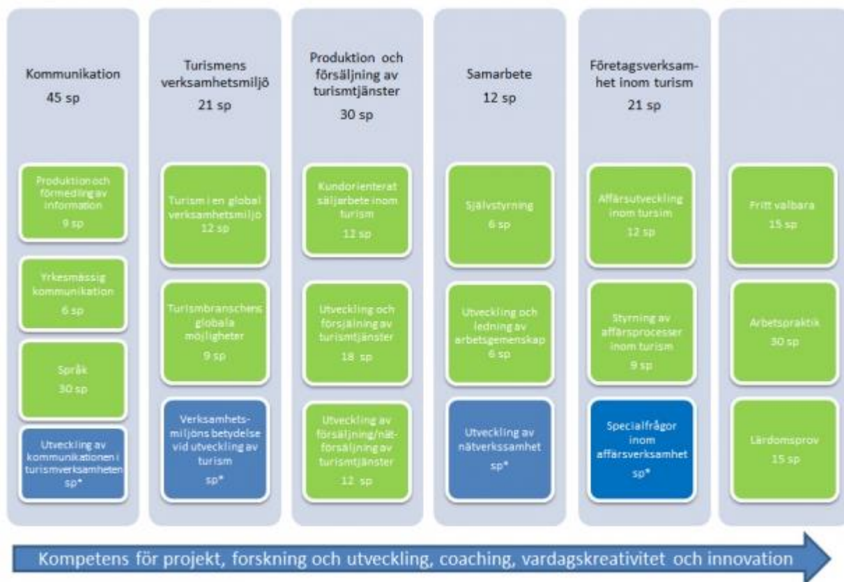
Figur: Struktur, moduler och studieperioder för restonomstudier. (De blå rutorna representerar fritt valbara studier) * individuellt val av studiepoäng