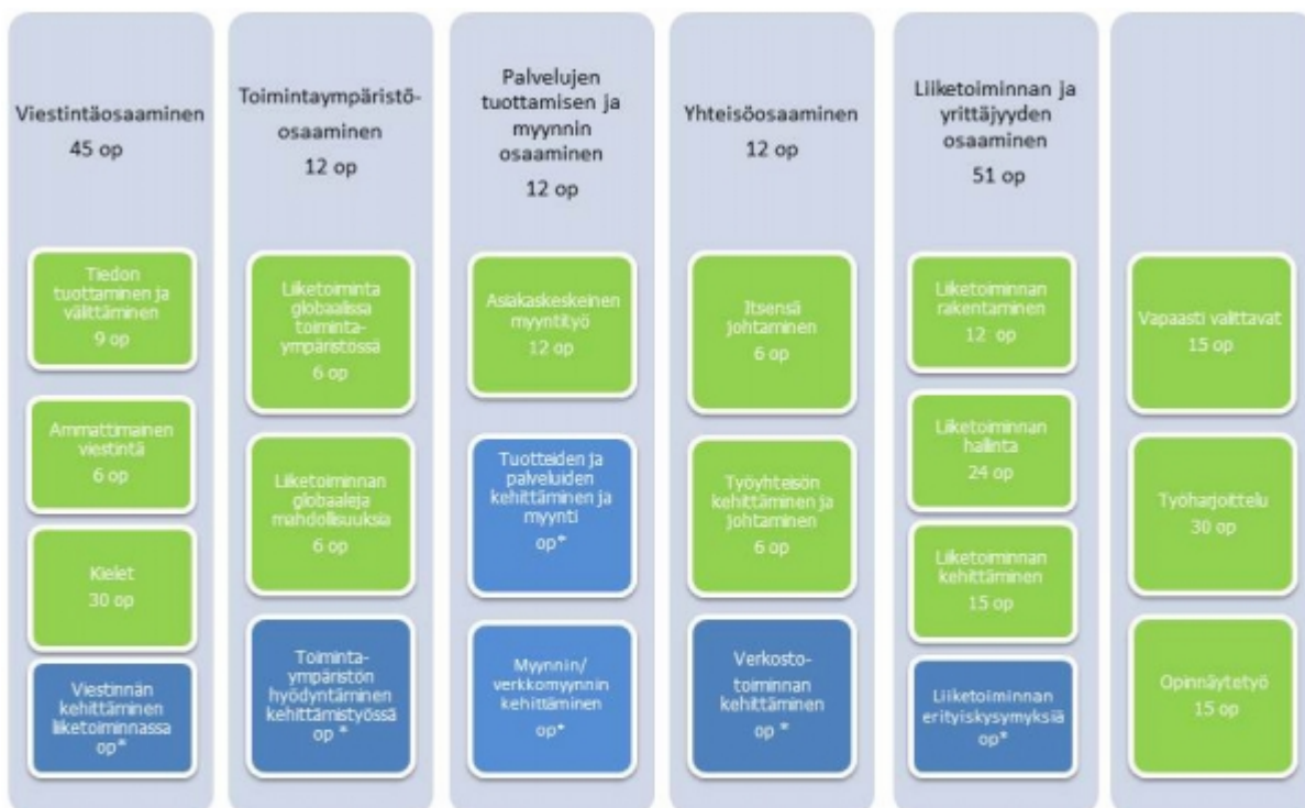
Kuvio 2: Tradenomin opintojen rakenne, moduulit ja opintojaksot. (Siniset laatikot kuvaavat vapaasti valittavia moduuliopintoja) * opintopistemäärä yksilöllisesti valittavissa.

Opiskelija voi henkilökohtaisen opetussuunnitelmansa mukaisesti hyödyntää Campuksen tarjoamaa mahdollisuutta toimia eri koulutusohjelmien projekteissa ja opintokokonaisuuksissa suomen, ruotsin ja englannin kielellä, mikä laajentaa hänen erikoistumismahdollisuuksiaan.